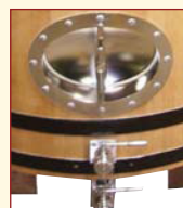
Option : Porte Inox